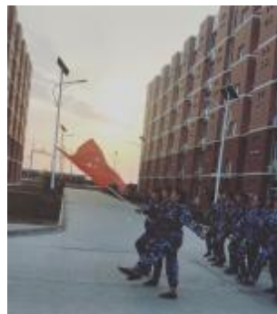
亦师亦友同训练，教官学生共苦甜