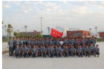
爱军习武，巩固国防