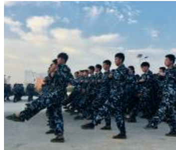
做志存高远、学业精深、体魄强健的兴华人