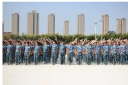
争当训练标兵，共创先进连队